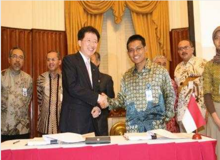
〈국내 L 사 프로젝트 수주 계약식〉