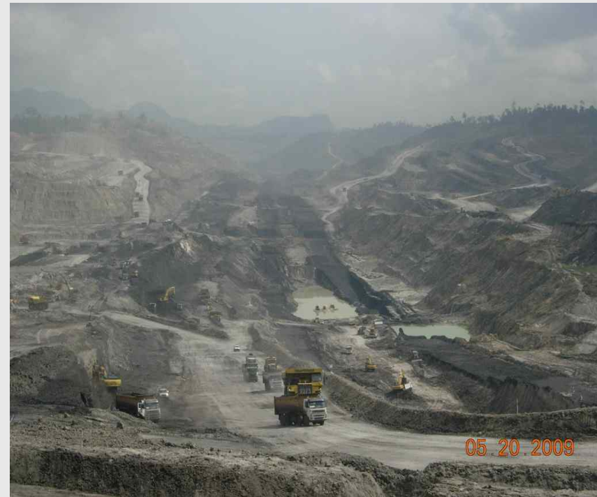
〈자 원: KIDECO 광산〉